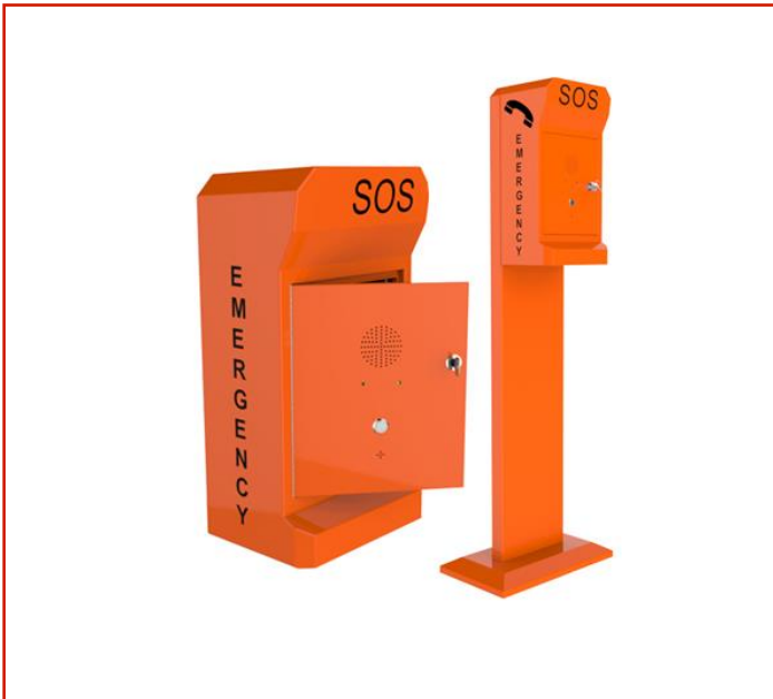
Teléfono de emergencia