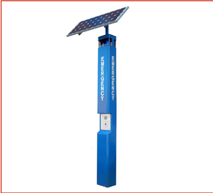
Teléfono de emergencia