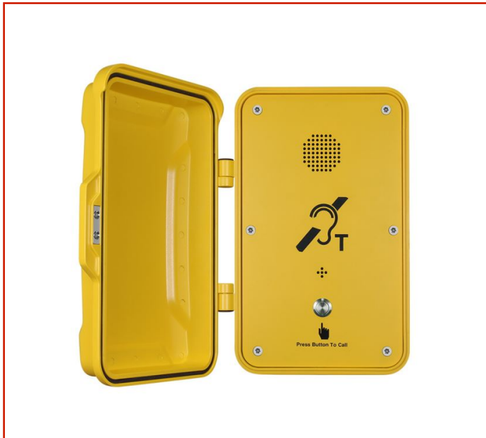
Teléfono resistente a la intemperie

Modelo: JR102-SC : Ideal para Metro, Ferrocarril, Carretera, Marina, Minería, Túneles, Planta de Acero, Planta Química, Planta de energía y aplicaciones industriales relacionadas, etc.