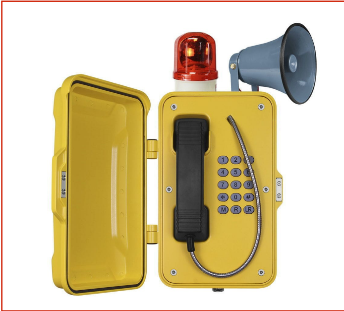
Teléfono resistente a la intemperie